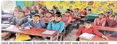
बसई मुहम्मदपुर पंचायत के प्रारंभिक विद्यालय की स्मार्ट कक्षा में पढ़ते बच्चे