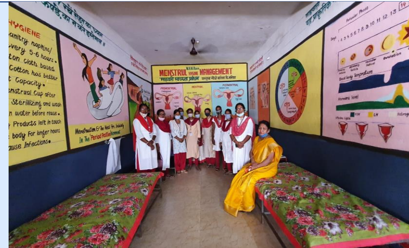
MHM Lab KGBV, Noamundi