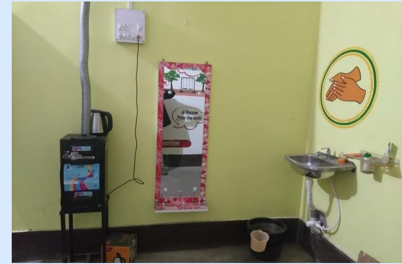
Electric Incinerator installed in Jaridih, Bokaro

Mukhiya Jaridih, Bokaro leveraged funds from CCL for setting up Pad Production Centre, run by SHG women. Similarly, utilized 15 FC funds for setting up MHM Labs and incinerators in Jaridih School.