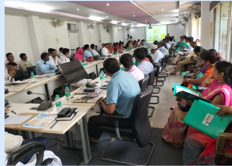
Deoghar district level orientation during the campaign