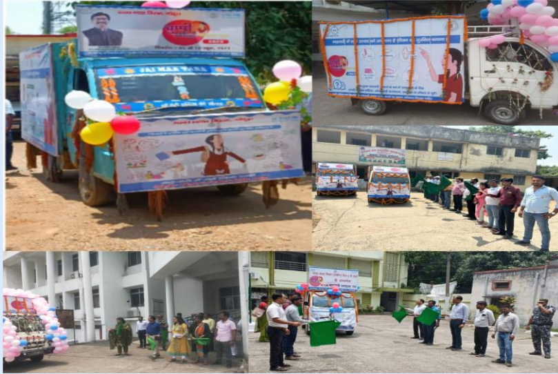
Flag off of Mahwari Swachhta Van by DC's in the district during 2023 campaign