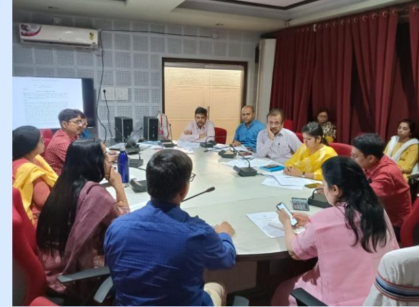
MHM Core Committee Meeting – Directorate of SBM (G)

Letter No. 332 MHM compliant Toilets (Pad vending machine & incinerators for safe disposal) in all Government Institutions