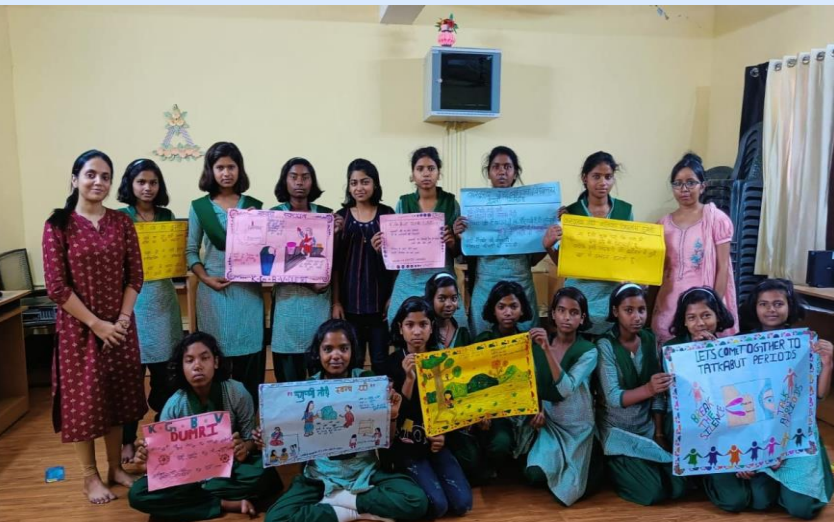
Slogan competition in KGBV Dumri, Giridih