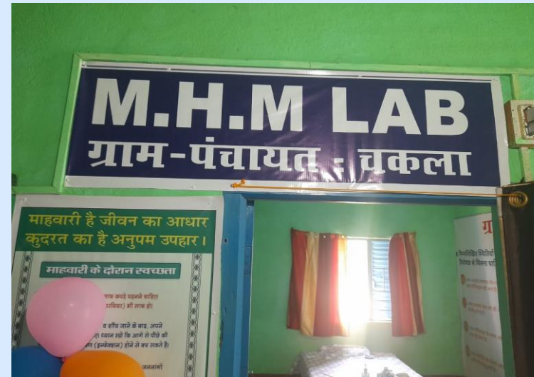
MHM Lab ensured through CSR funds in Latehar