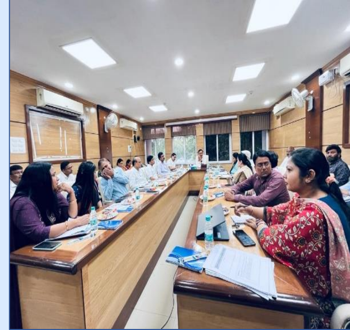
MHM Meeting under the chairmanship of Development Commissioner, Health

Letter issued by MD – NHM cum Development Commissioner, Government of Jharkhand on MHM