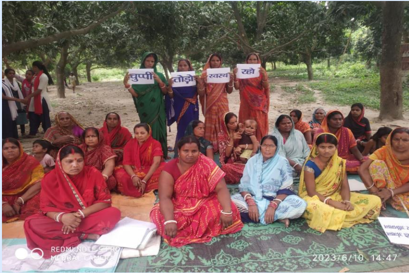
Village level discussions