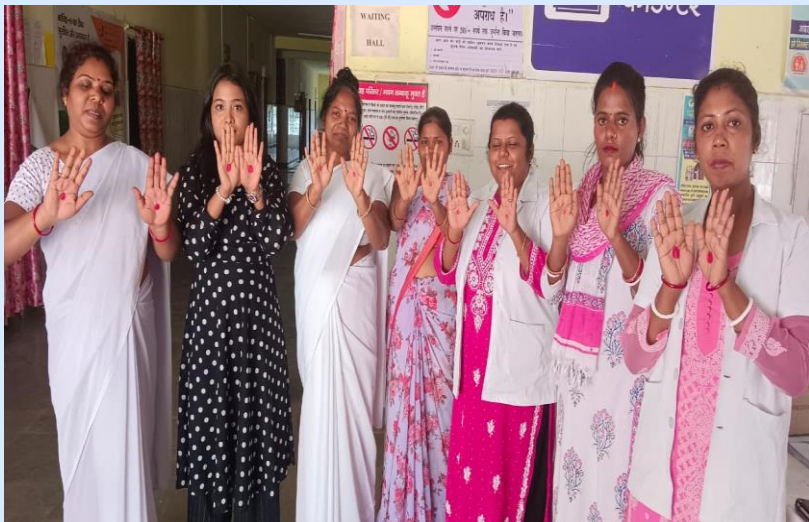
RedDot Challenge in CHC Bandhgaon, West Singhbhum