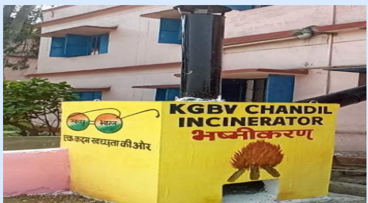
Manual Incinerator in KGBV Chandil