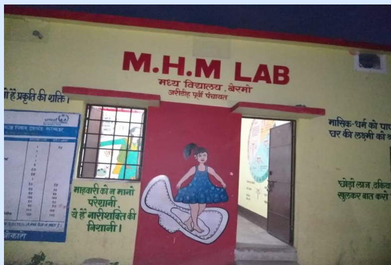
MHM Labs in Bermo, Bokaro