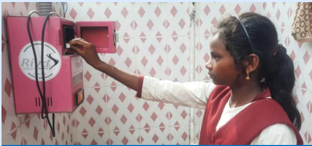
Chuppi Todo Swasth Raho Campaign

Swachh Bharat Mission (G) Govt. of Jharkhand initiated “Chuppi Todo Swasth Raho” awareness campaign in 2019 to help community break the taboos circling around menstruation. Each year the campaign is initiated on the occasion of World MH day with specific theme. Our Jal Sahiya, Rani Mistri and Swachhgrahi’s have played a pivotal role in bringing people together.