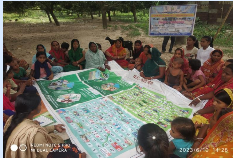
LUDO Game in Sahibganj