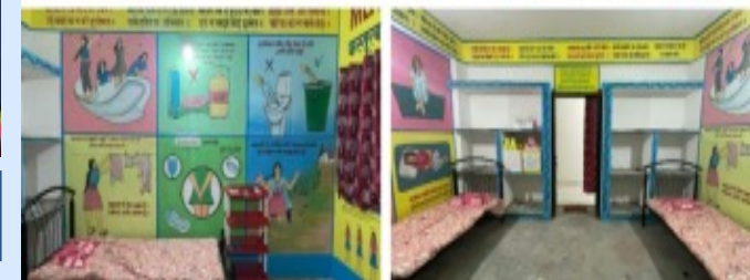
MHM Lab KGBV, Meharma (Godda)