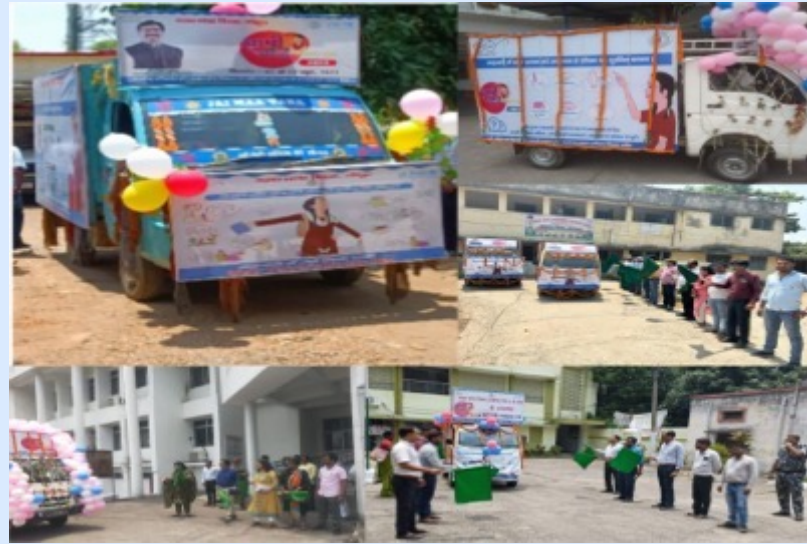
Flag off of Mahwari Swachhta Van by DC's in the district during 2023 campaign