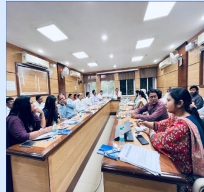
MHM Meeting under the chairmanship of Development Commissioner, Health

Letter issued by MD – NHM cum Development Commissioner, Government of Jharkhand on MHM