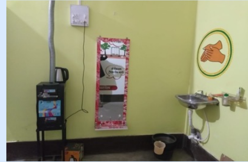
Electric Incinerator installed in Jaridih, Bokaro

Mukhiya Jaridih, Bokaro leveraged funds from CCL for setting up Pad Production Centre, run by SHG women. Similarly, utilized 15 FC funds for setting up MHM Labs and incinerators in Jaridih School.