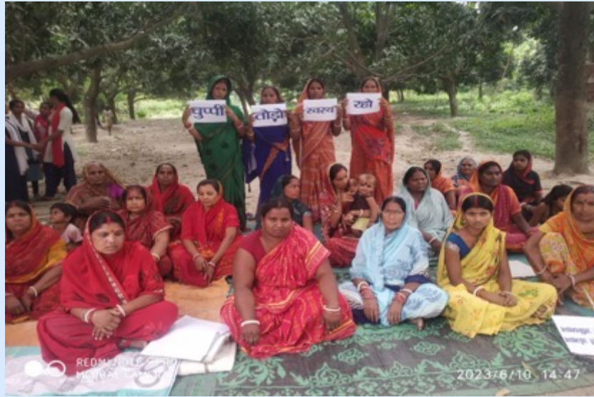
Village level discussions