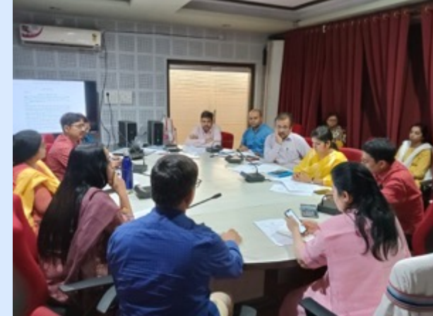
MHM Core Committee Meeting – Directorate of SBM (G)

Letter No. 332 MHM compliant Toilets (Pad vending machine & incinerators for safe disposal) in all Government Institutions