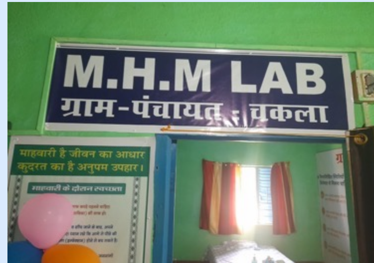
MHM Lab ensured through CSR funds in Latehar