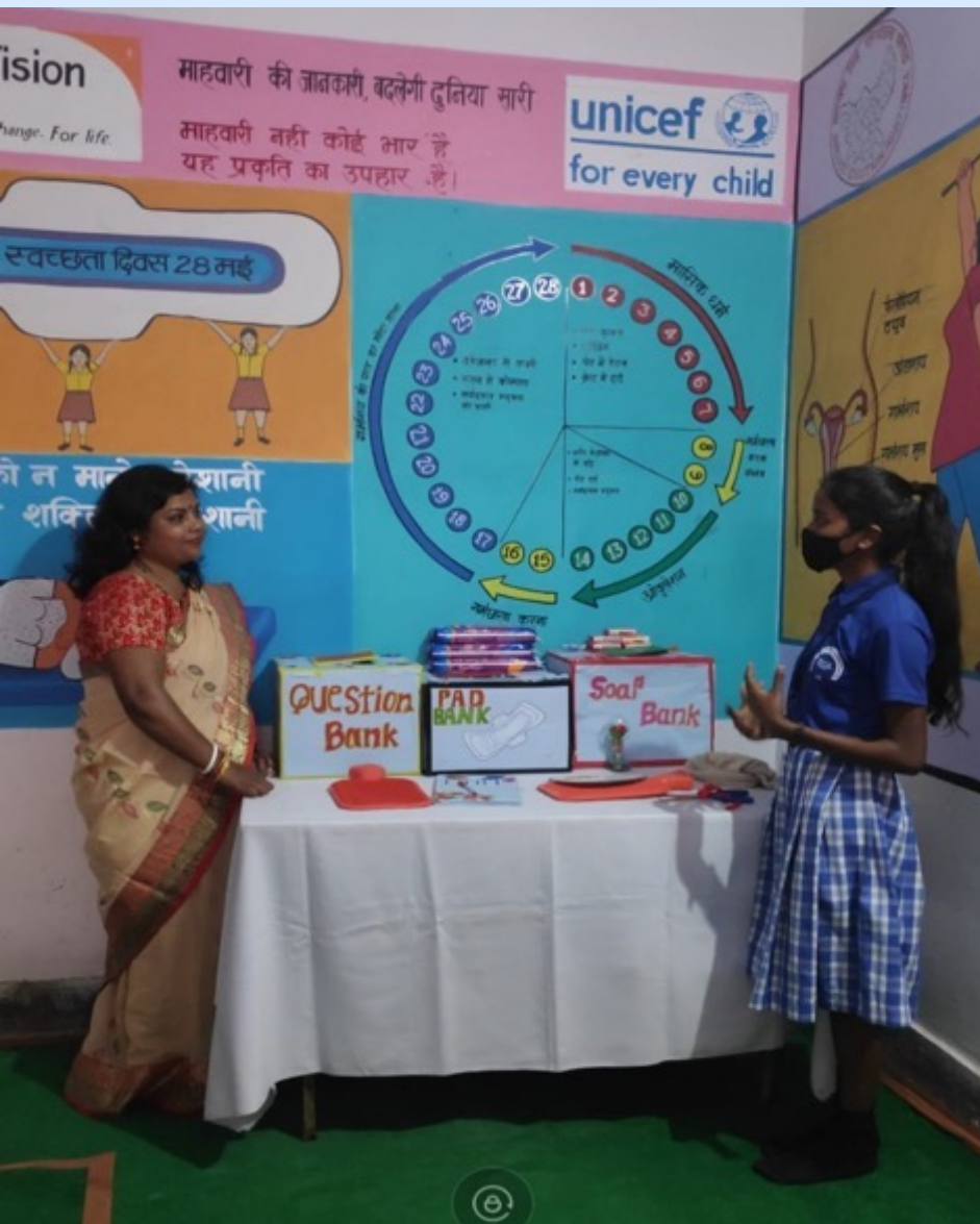
MHM Lab, KGBV Kanke