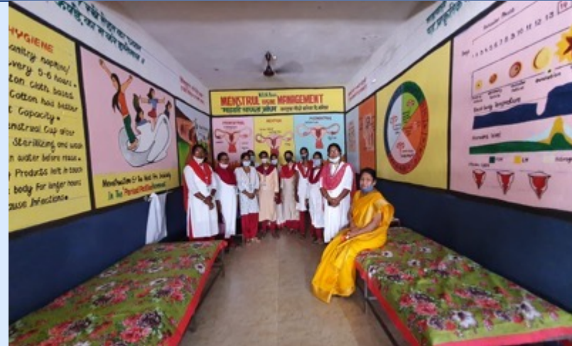
MHM Lab KGBV, Noamundi