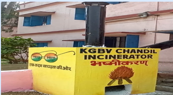
Manual Incinerator in KGBV Chandil