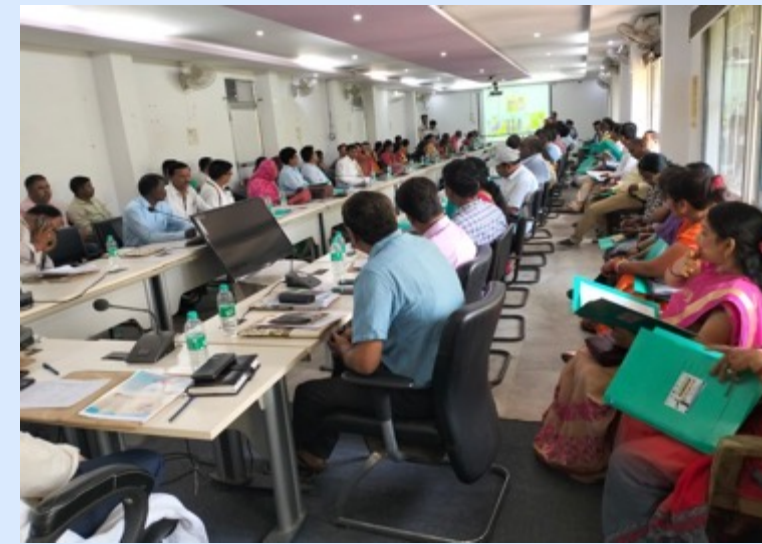
Deoghar district level orientation during the campaign