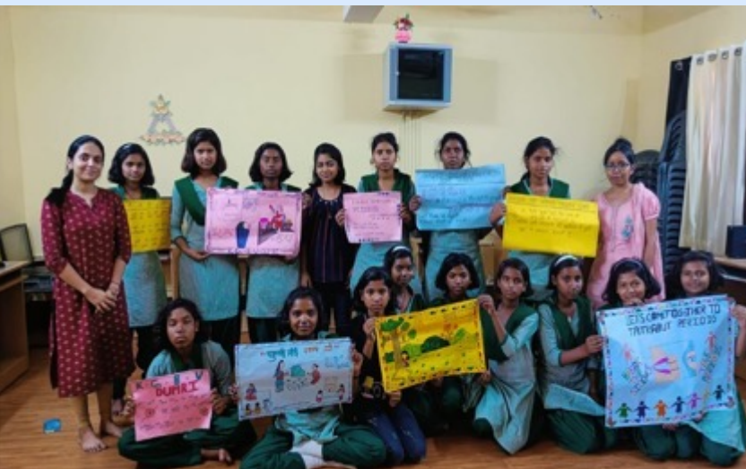
Slogan competition in KGBV Dumri, Giridih