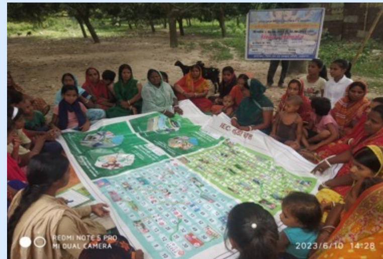
LUDO Game in Sahibganj