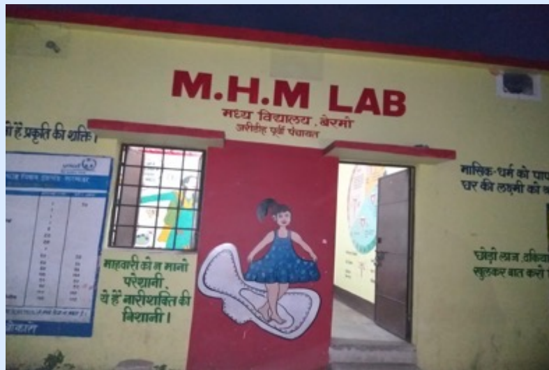
MHM Labs in Bermo, Bokaro