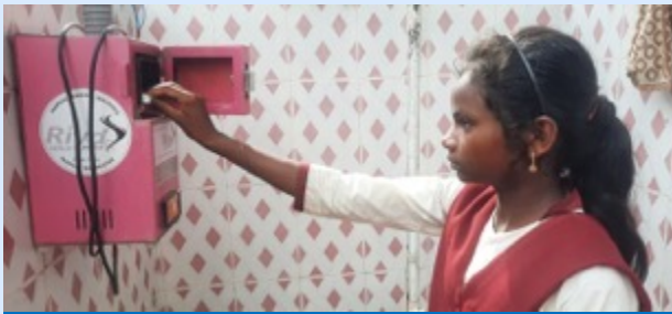
Chuppi Todo Swasth Raho Campaign

Swachh Bharat Mission (G) Govt. of Jharkhand initiated “Chuppi Todo Swasth Raho” awareness campaign in 2019 to help community break the taboos circling around menstruation. Each year the campaign is initiated on the occasion of World MH day with specific theme. Our Jal Sahiya, Rani Mistri and Swachhgrahi’s have played a pivotal role in bringing people together.