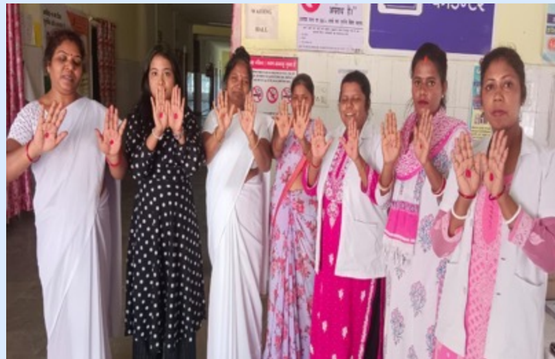
RedDot Challenge in CHC Bandhgaon, West Singhbhum