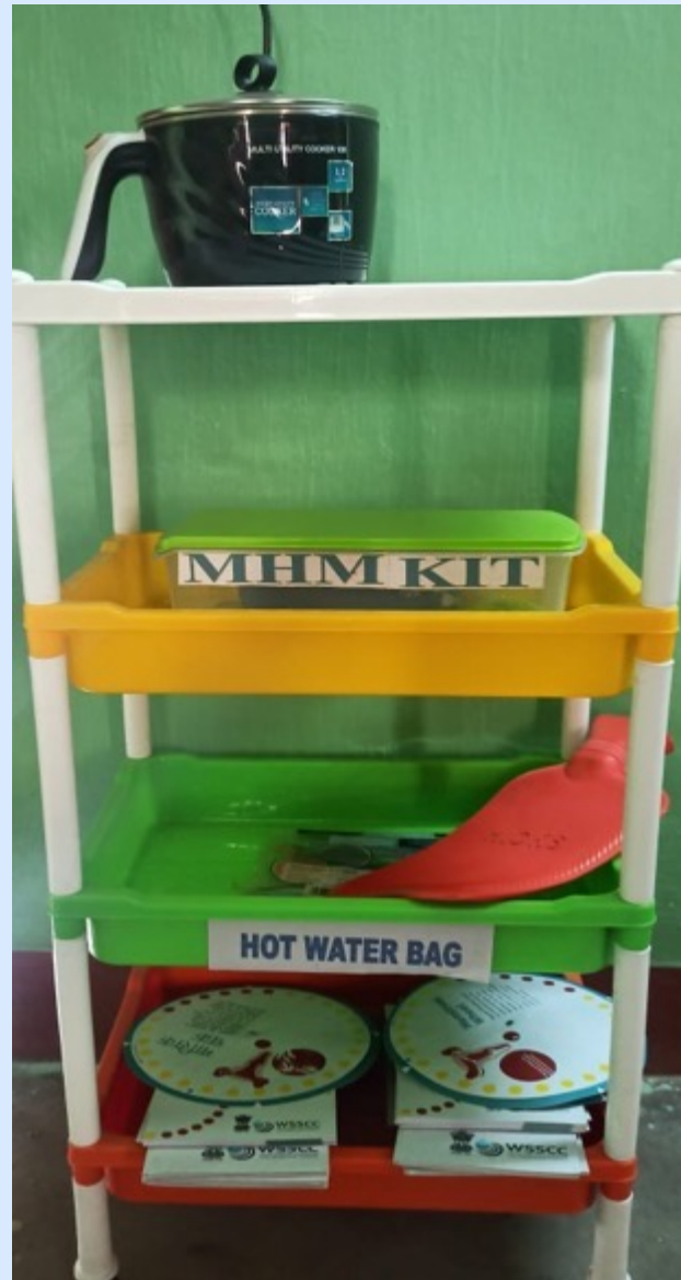
Facilities in MHM Lab, KGBV CKP & KGBV Chaibasa